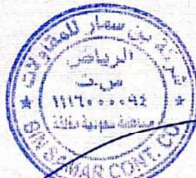
MASSAD BIN SAMMAR ALOTAIBI