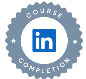
Head of Global Content, Learning

Certificate ID: 2704d3c599e65676adf8e4dec839acaaf39121098e988b1c0c52c8c7a160993a