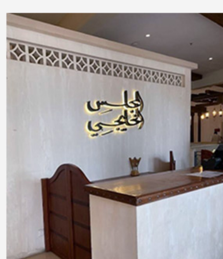
مطعم المجلس الخليجي