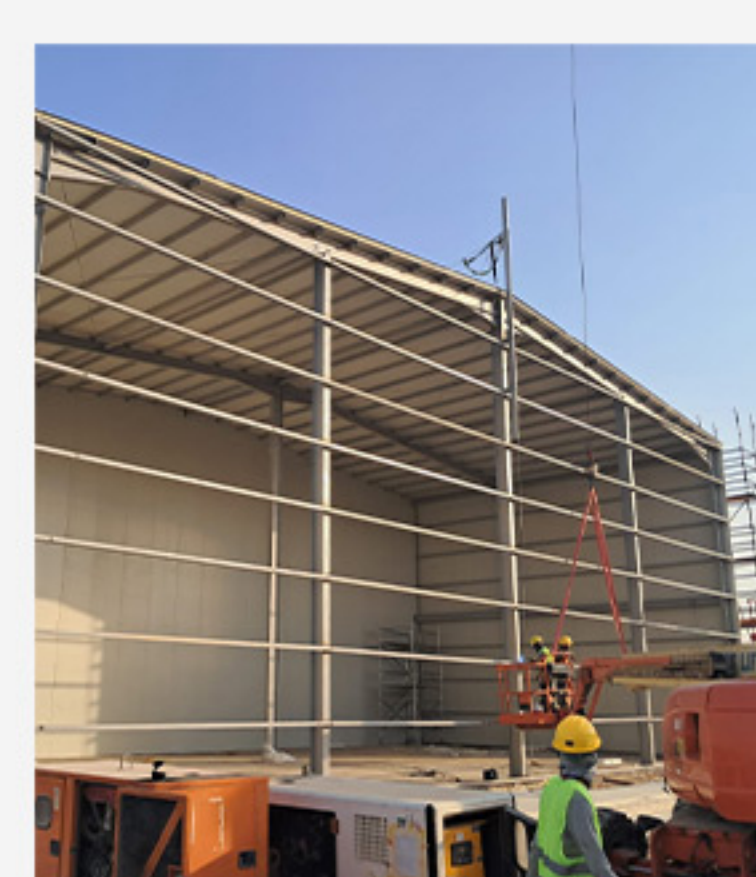
هناجر الدرعيه شركه السيف