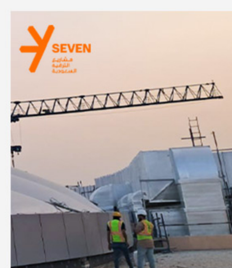
موقع EXIT 10 Y7