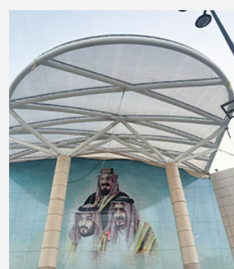
مشروع الحياه مول